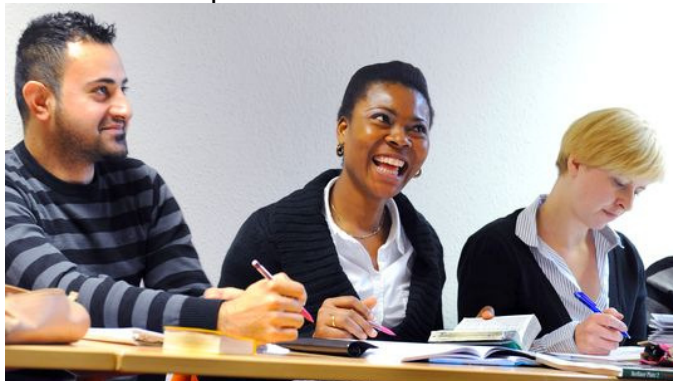
Menschen mit Migrationshintergrund in einem Integrationskurs in Leipzig

Überraschendes Ergebnis einer Bertelsmann-Studie: Migranten sind demnach bei den Themen Familie und Beruf emanzipierter und karriereorientierter als Nicht-Migranten.