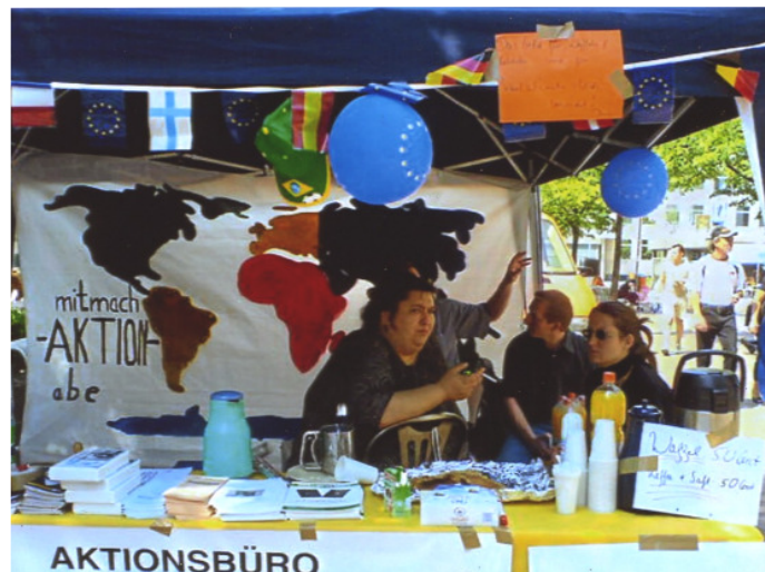
Abb. 1, Ein Bild von der „Mitmach-Aktion“ vom 24. Juni 2006 in Bochum

Die Details sind auch auf unserer Seite zu lesen: www.einbuergern.de